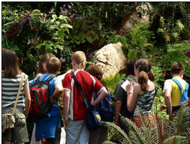
(sekunda A v botanické zahradě)