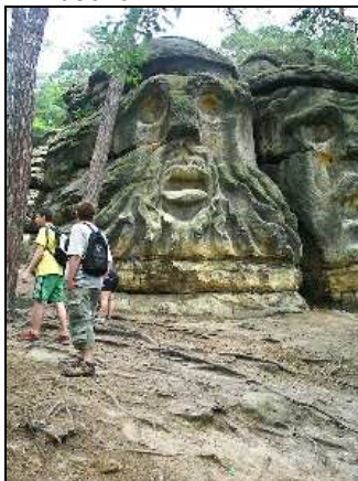
(branně turistický kurs kvint)