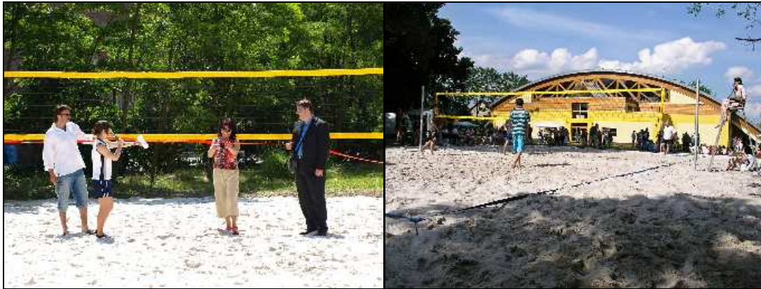
(Slavnostní otevření beach volejbalového hřiště – Majáles 2008)