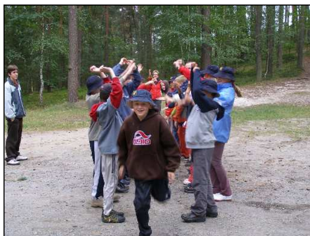
(adaptační kurs prim)