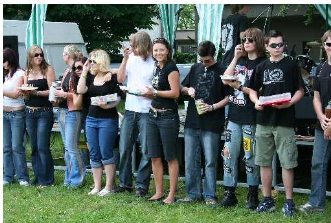
(Majáles 2008 – dekorování studentů kvart na studenty vyššího gymnázia)

Studentské majáles GFP je příležitost studentů ukázat schopnosti ve spoluorganizování akce, kulturním programu i společenské a veřejné práci. Při přípravě jsou aktivní zejména rodiče z Klubu přátel GFP, lobkovičtí hasiči a garantem technického zázemí je město Neratovice.