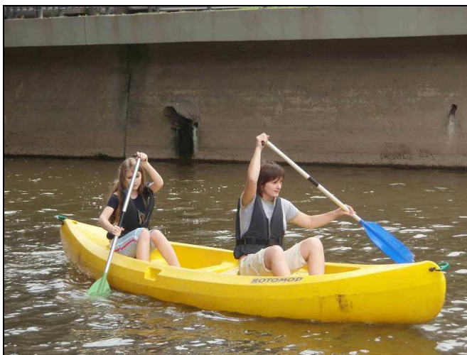
(vodácko-horolezecko-turistický kurs tercií)