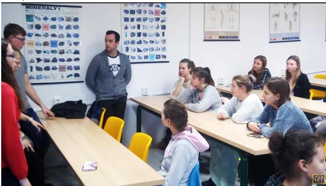
(z letošního setkání s absolventy GFP)

Učební plán vychází vstříc individuálním požadavkům žáků, v septimě a oktávě jim poskytuje širokou nabídku volitelných předmětů. Výběrem předmětů může každý žák dát konkrétní směr své další profesní orientaci. Pro sextány a septimány organizuje škola besedy s bývalými absolventy školy o přijímacím řízení na vysoké školy. Sextáni procházejí testy profesní orientace, absolvovali besedu s pracovníci Poradenského střediska pro volbu povolání.