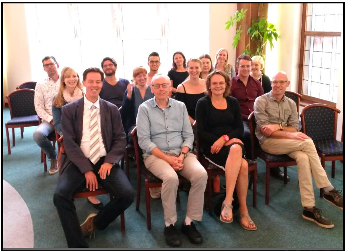
(účastníci mezinárodního mítinku učitelů – přijetí na neratovické radnici)

Geo-Circle by měl trvat 3 roky a měl by být zakončen (stejně jako předchozí projekt Geo-Water) v Nizozemsku (v roce 2021).