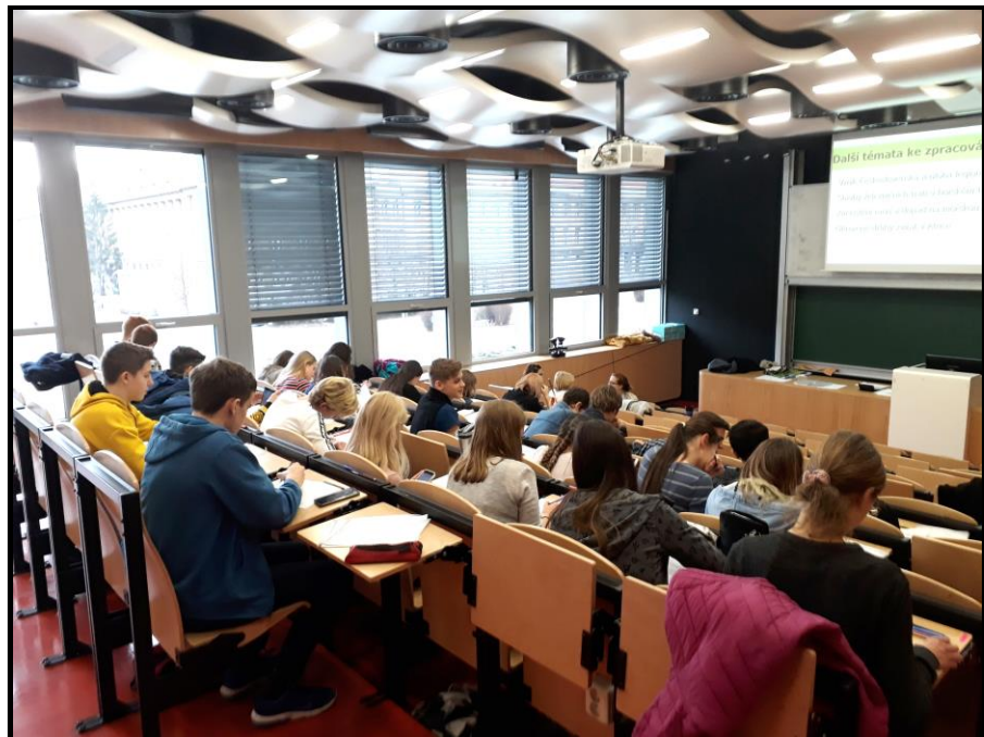
(kvintáni na ČVÚT Praha)

Projektu se zúčastnila v roce 2018/2019 jedna kvinta. V roce 2019/2020 se ho zúčastní jedna sexta.