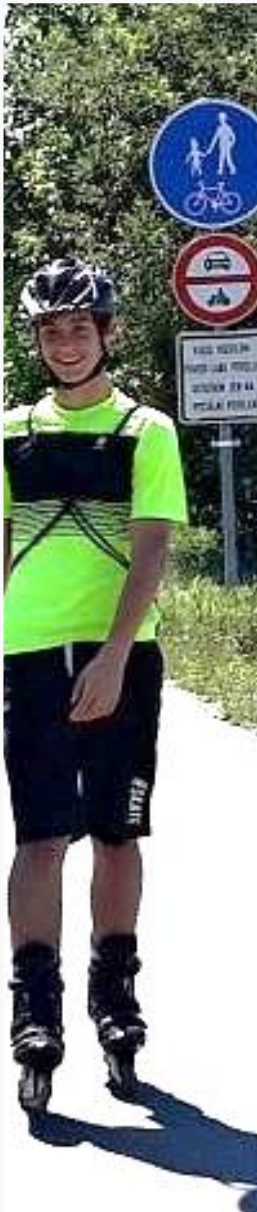
Inline brusle Kostelec - Brandýs